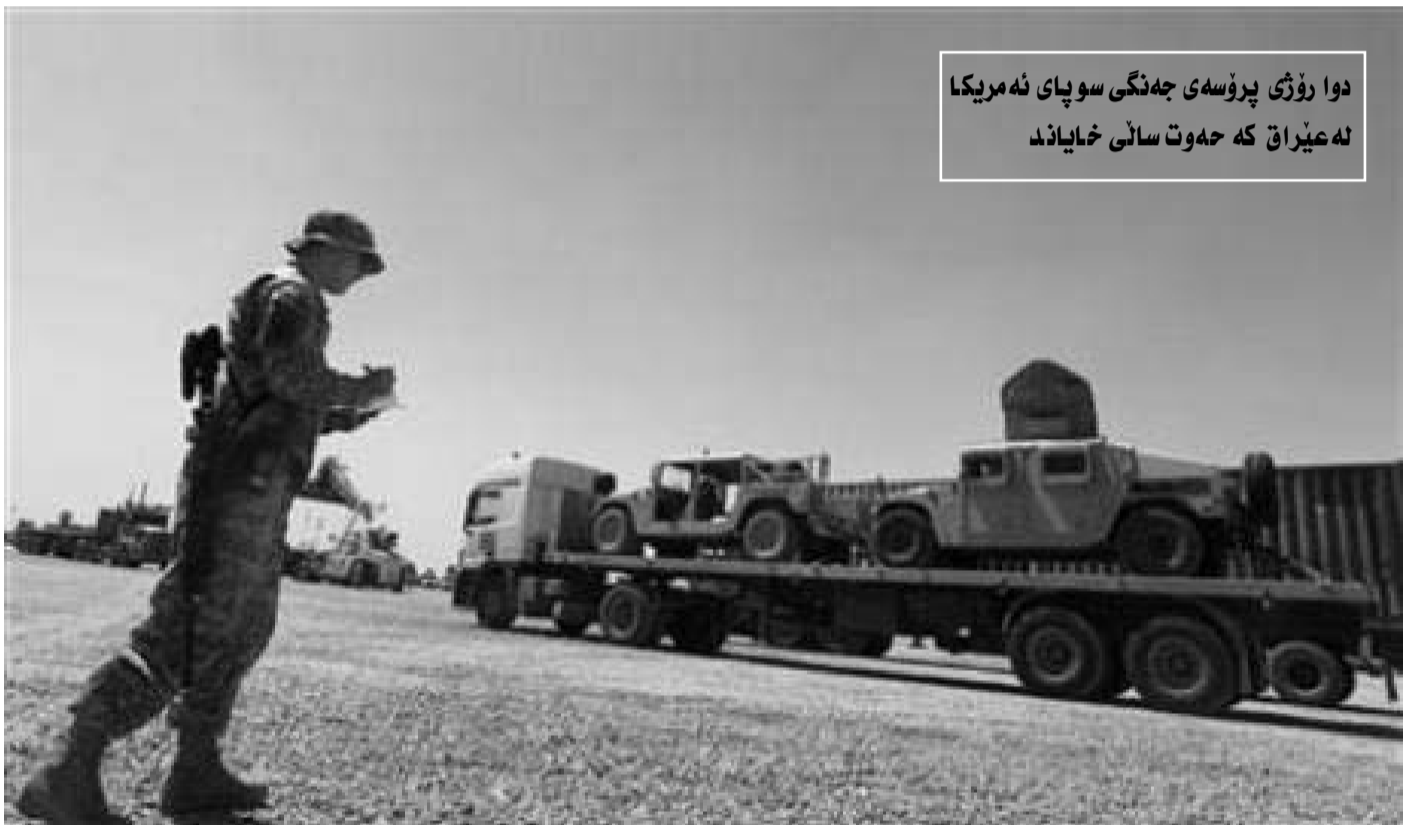
دوا روژی پرۆسه ی جهنگی سوپای نه مریکا له عێراق که جهوت سانی خایاند.

له دیمانه یهکی له گهڵ رێگی کوردستاندا به ریوه بهری گشتی شاره وانیه کانی سلیمانی رایده گه یه نیت که له بهشه بودجهی پهره پیدانی پارێزگاگاندا، بۆ نه مسال ۴۰ ملیار دینارمان بۆ دانراوه، له کاتیکیا ئیتمه پیتشیاری ۷۷ ملیارمان کردبوو، به لام به م ۴۰ ملیاره (18) پرۆژه مان داناوه کاری تیدا بکهین، له سهر پرسی به دوا دا جوونی نایاسایی و گهنجانی وتی: له زۆریه شاره وانیه کانی ئیختیلاسیه کراوه، ههبووه دوو زهوی وهگرتهوه پیتشیارمان کردوه مامه له کهی