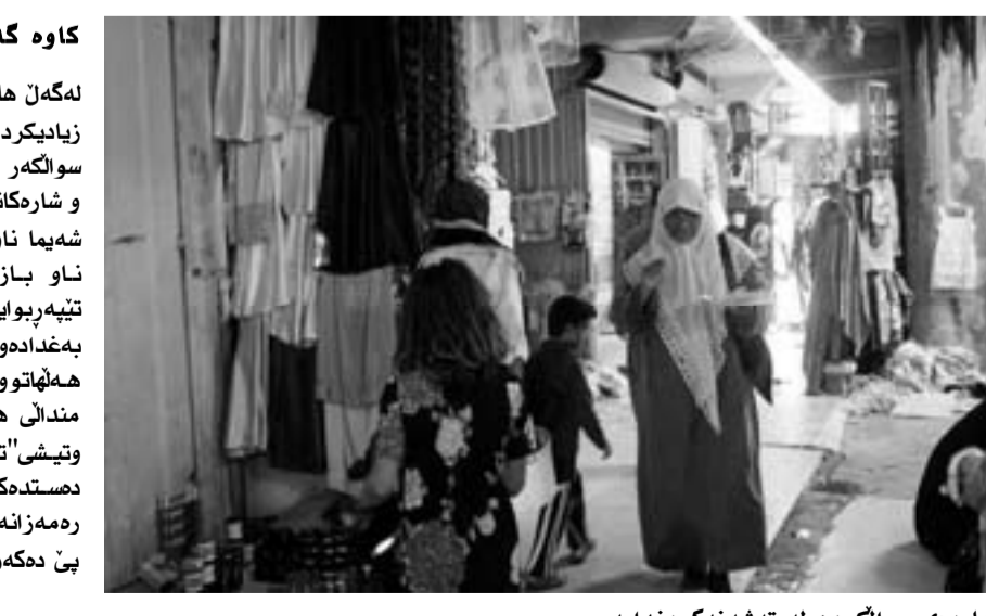
دیاردی سوال کردن له ته شه نه کردن دایه

سوال کردن هه موو که له بهریکی نه م واته ی گرتۆته وه، نه توانرا وه چاره سه ر یکی گونجاوی بۆ بگریت